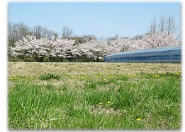
能登半島地震で震度7を記録した志賀町富来・香能で咲いていた桜